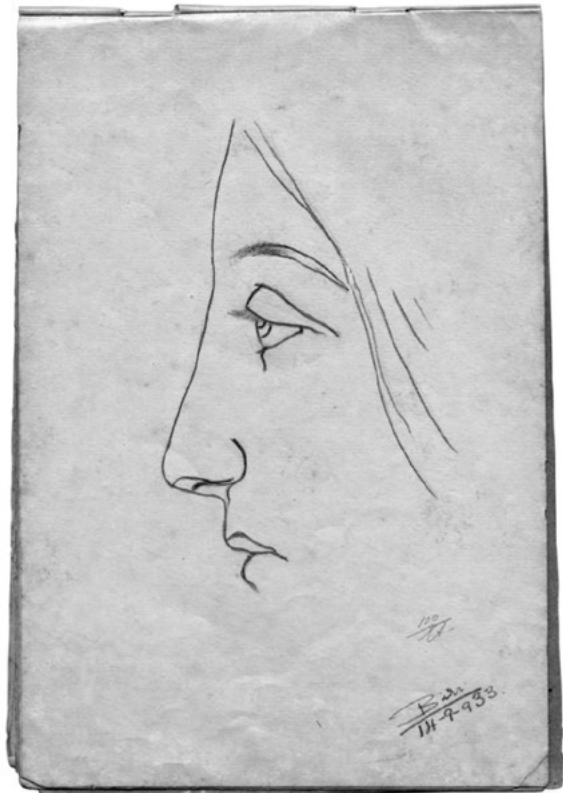
DESENHO DE UM CADERNO ESCOLAR DE BIBI