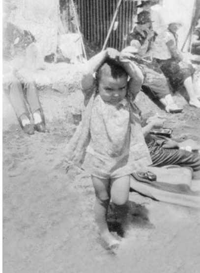
NA PRAIA, EM VIÑA DEL MAR, NO CHILE