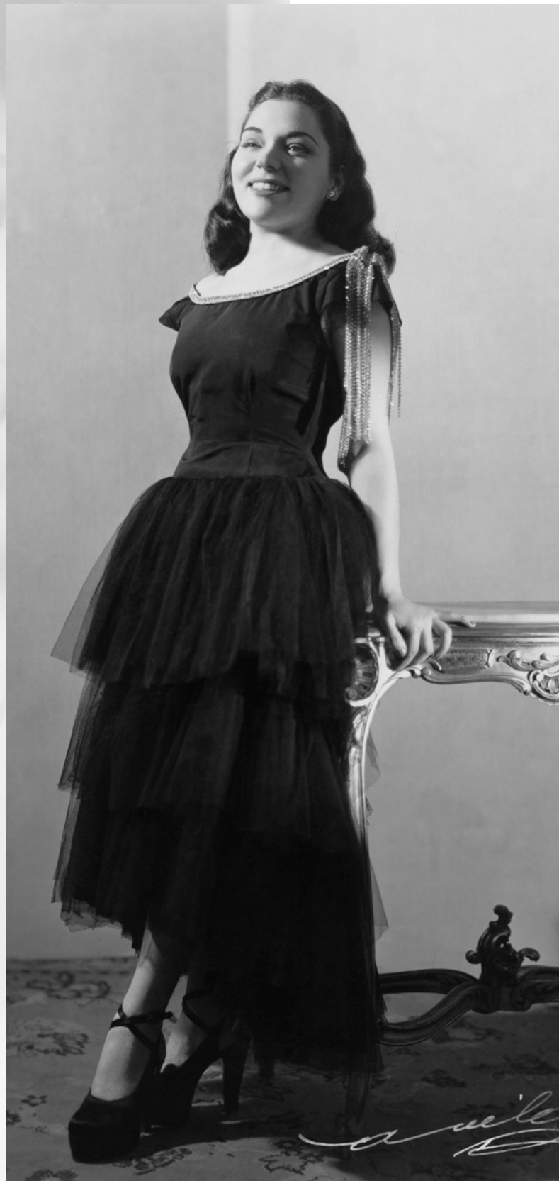
BIBI COMO BAILARINA: "MUITO HOLLYWOOD ANOS 40 - EU COPIAVA GENE TIERNEY."