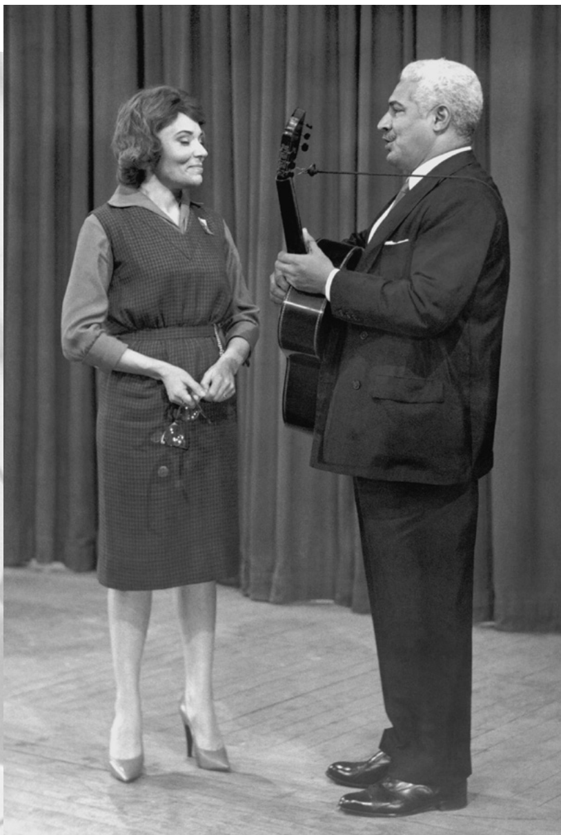
BIBI E DORIVAL CAYMMI EM BRASIL 64, NA TV EXCELSIOR