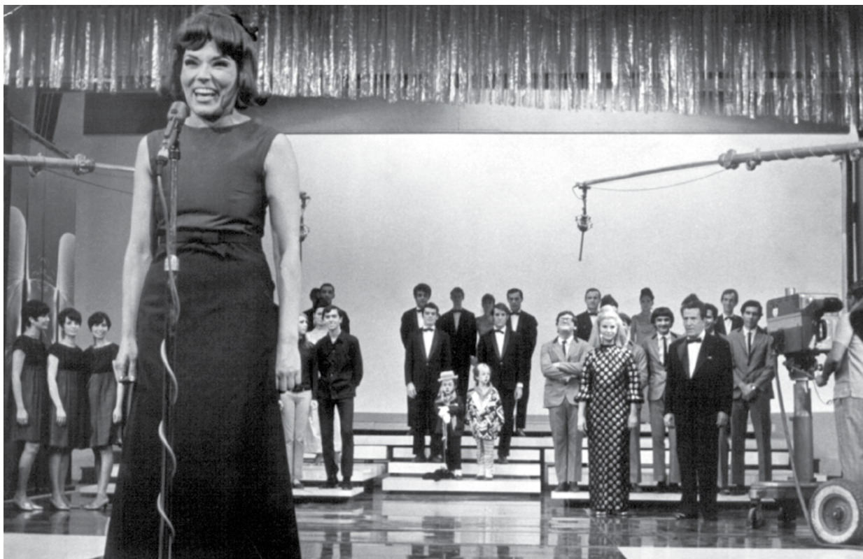
BIBI NA TV, TENDO AO FUNDO VÁRIOS ARTISTAS, INCLUINDO TÔNIA CARRERO, VICENTE CELESTINO, QUARTETO EM CY, ENTRE OUTROS