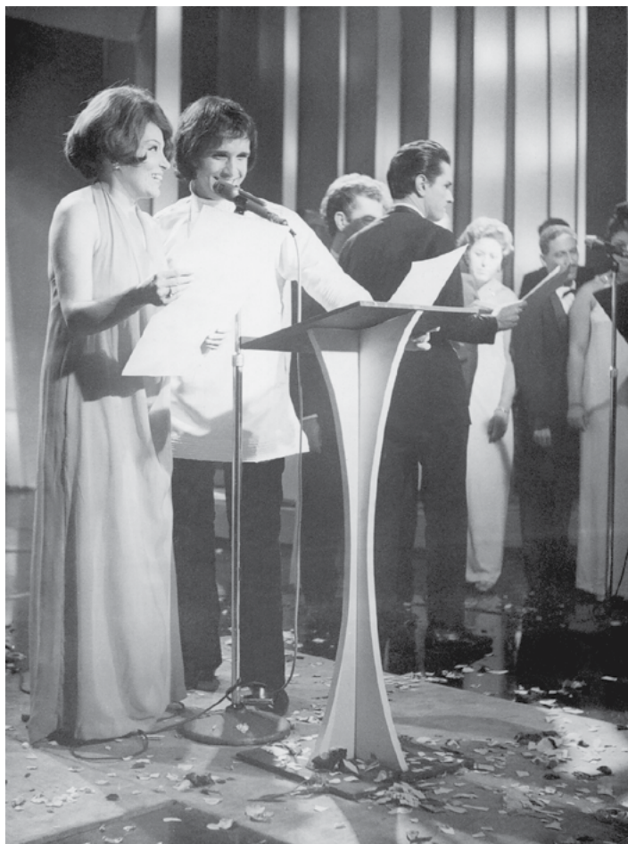
BIBI E ROBERTO CARLOS EM BIBI SEMPRE AOS DOMINGOS

"Bibi Ferreira é sem dúvida a grande dama da nossa televisão. Seu programa na TV Tupi, o Bibi ao vivo, tem dado provas disso: sua versatilidade, seu charme, seu gabarito para apresentá-lo e a fidalguia com que trata seus convidados fazem de Bibi Ferreira no seu "ao vivo" verdadeira mestra de cerimônia de um dos programas de maior categoria de nossa televisão"