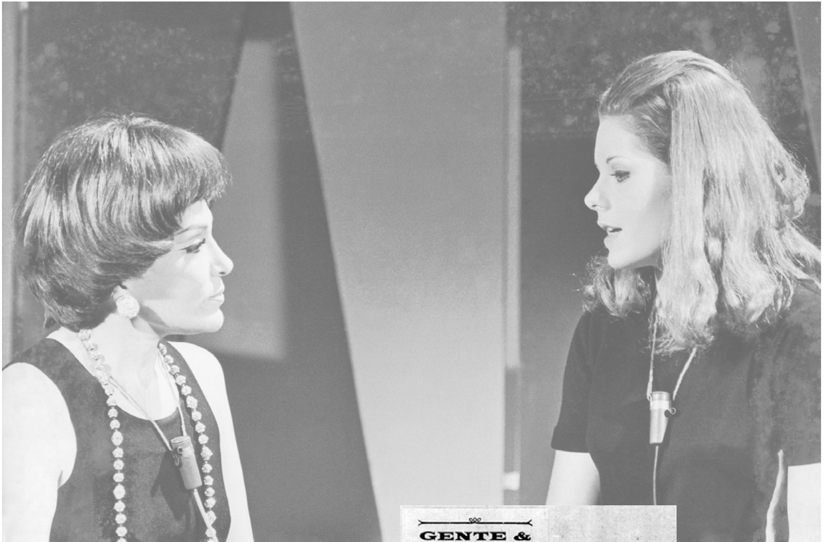
BIBI E VERA FISCHER, RECÉM ELEITA MISS BRASIL, EM BIBI AO VIVO, NA TV TUPI