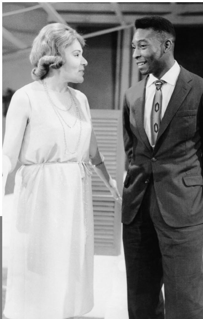
BIBI COM PELÉ EM BIBI SEMPRE AOS DOMINGOS NA TV EXCELSIOR