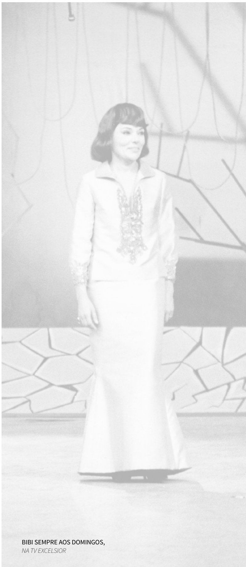
BIBI SEMPRE AOS DOMINGOS, NA TV EXCELSIOR