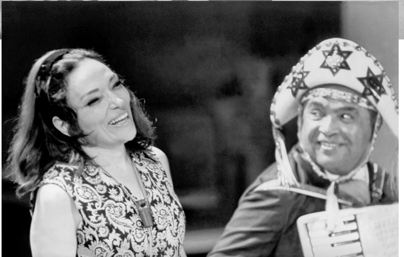
BIBI COM LUIZ GONZAGA EM BIBI AO VIVO, NA TV TUPI