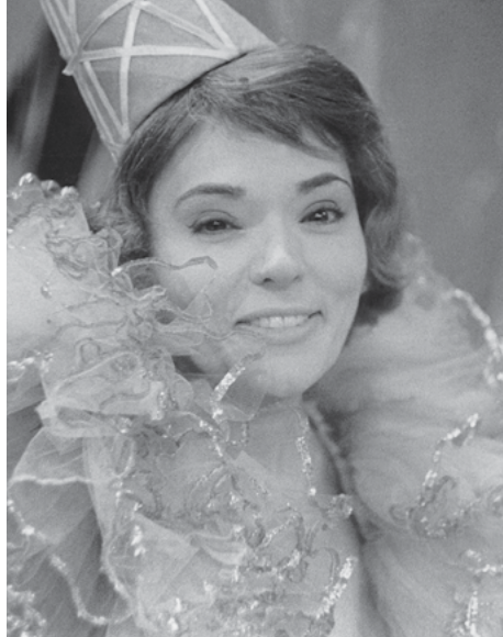
BIBI NO FESTIVAL DO CARNAVAL DA TV TUPI NO MARACANÃZINHO