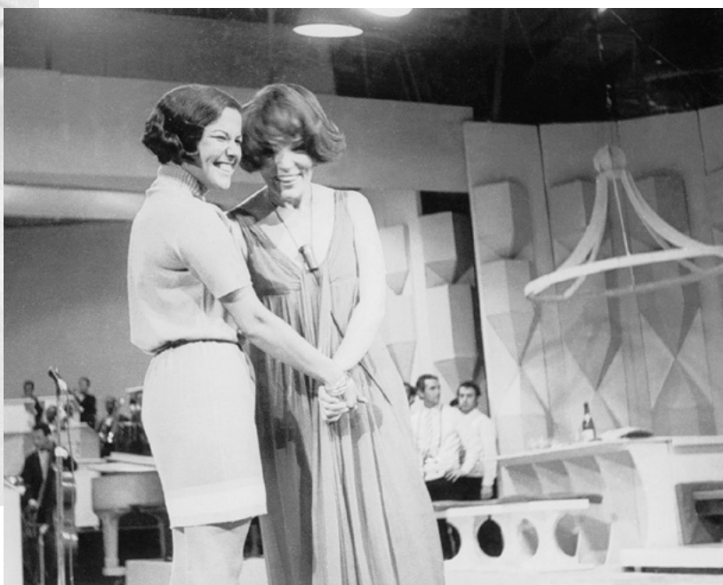
BIBI COM ELIS REGINA EM BIBI SEMPRE AOS DOMINGOS, NA TV EXCELSIOR