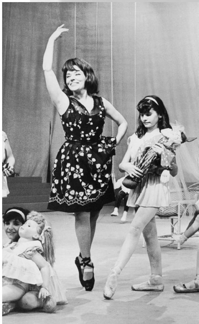
BIBI NA TV. "NA PONTA DO PÉ, DEVIA ESTAR DANDO BOM EXEMPLO PARA AS MENINHAS FAZEREM O QUE EU FAZIA, EU ERA METIDA A DAR EXEMPLO."